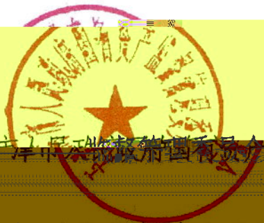
天津市人民政府国有资产监督管理委员会